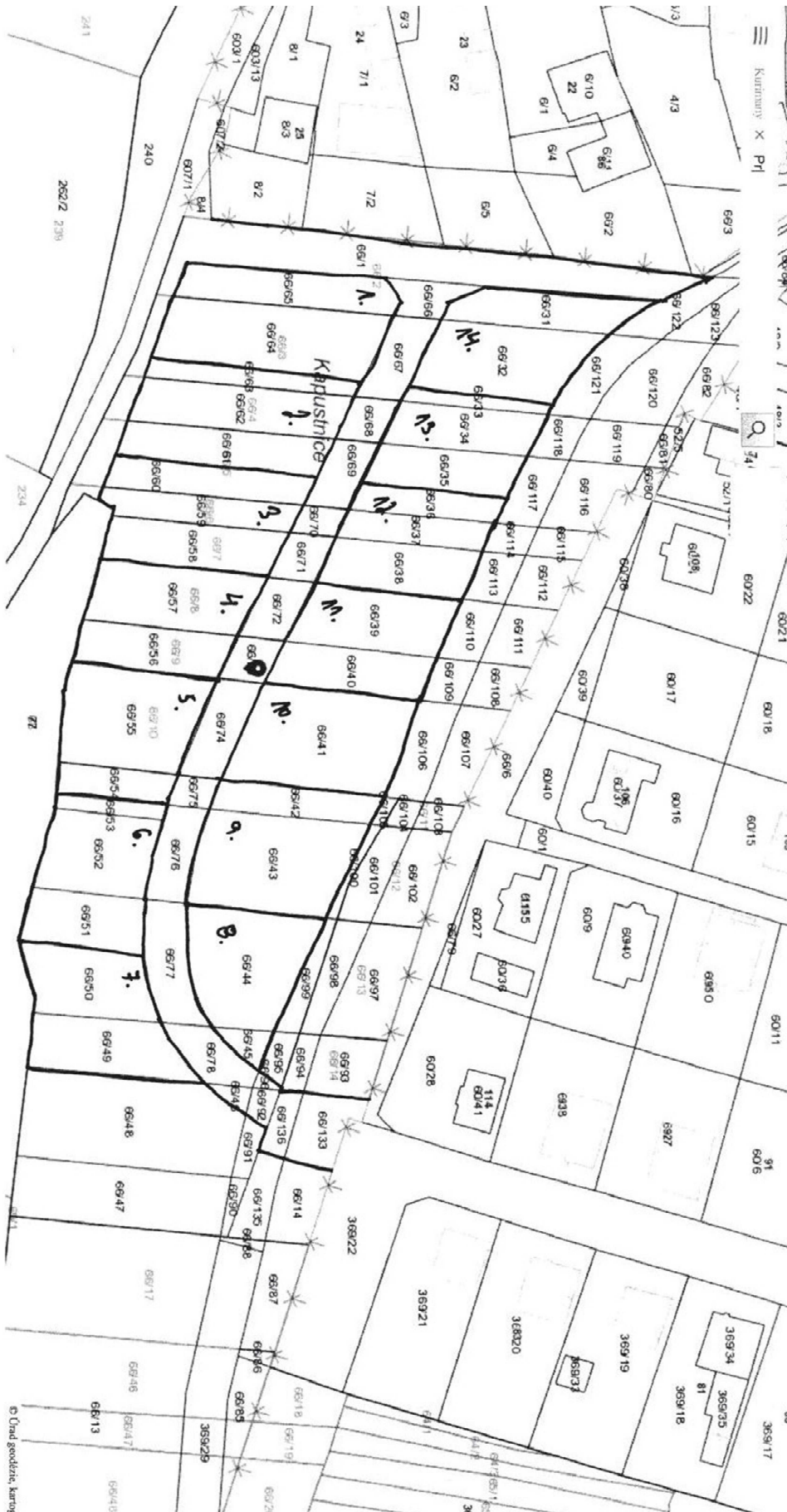
Príloha č. 2: